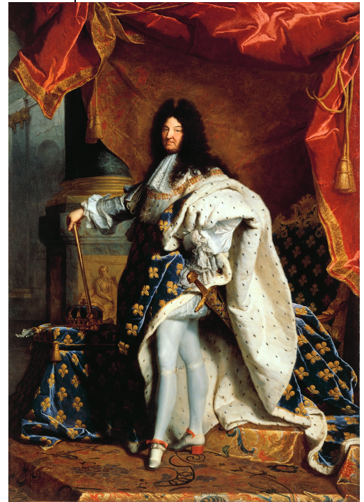
Abbildung 3: Ludwig XIV. im Krönungsornat (Porträt von Hyacinthe Rigaud, 1701)

Wie Ludwig XIV. glaubten viele Könige von sich, sie seien Herrscher „von Gottes Gnaden“, handelten also direkt im Auftrag von Gott. Auch die Kirche lehrte dies.